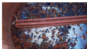
底面には多数の赤いサビの塊も